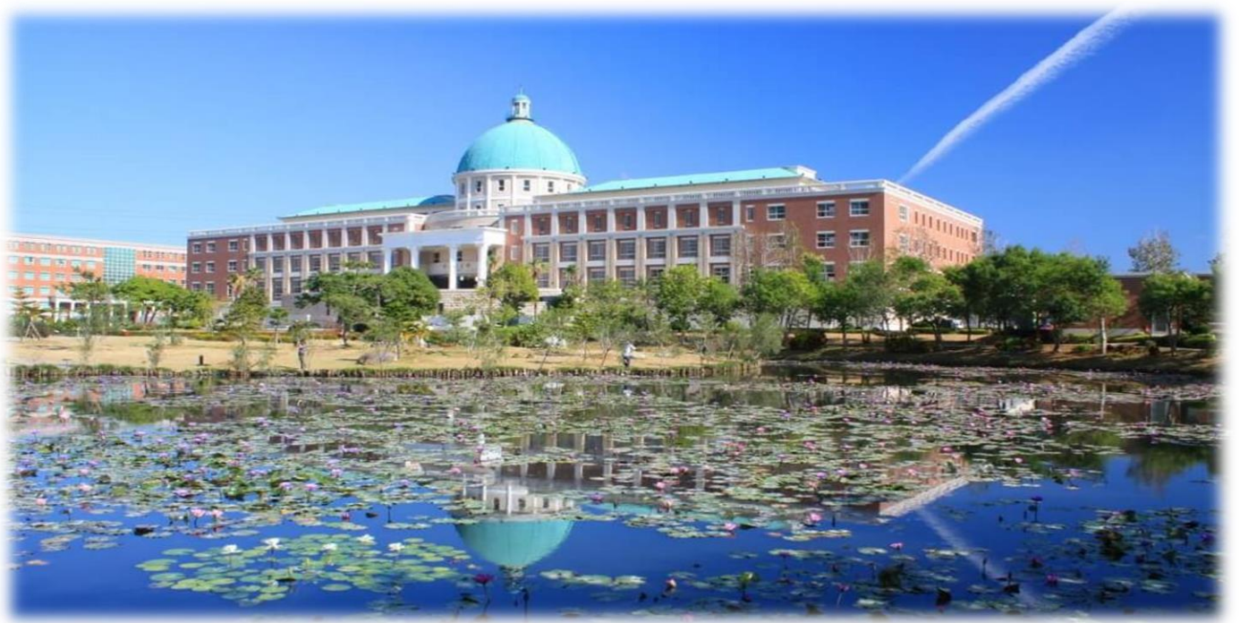
圖：就讀亞大，就是就讀一所「綜合大學」+「醫學大學」+「國際大學」